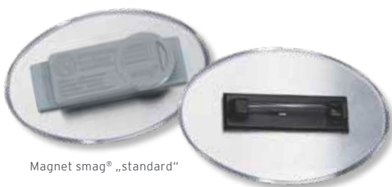
Magnet smag® „standard“